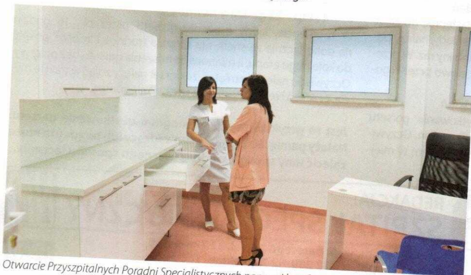
Otwarcie Przyszpitalnych Poradni Specjalistycznych poprawi komfort pacjentów.